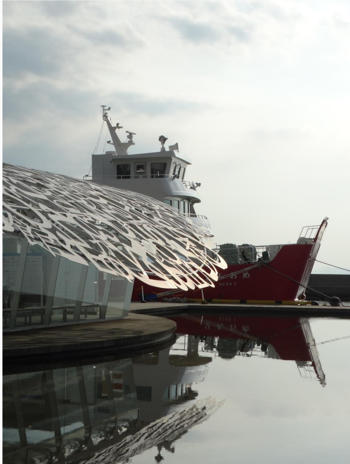
Ogijima Island 男木島