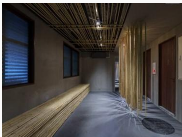
Bestie by Doyanen or equivalent 或相同