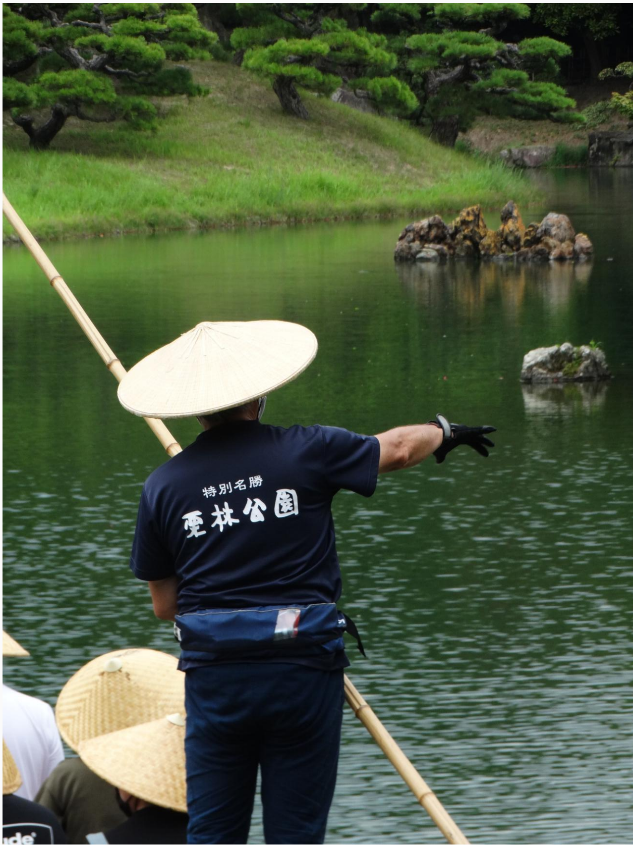
Ritsurin Garden 栗林公園