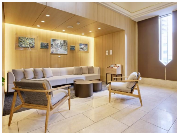
Takamatsu Park Hotel or equivalent 高松Park酒店或相同