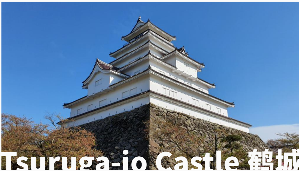
Tsuruga-jo Castle 鹤城