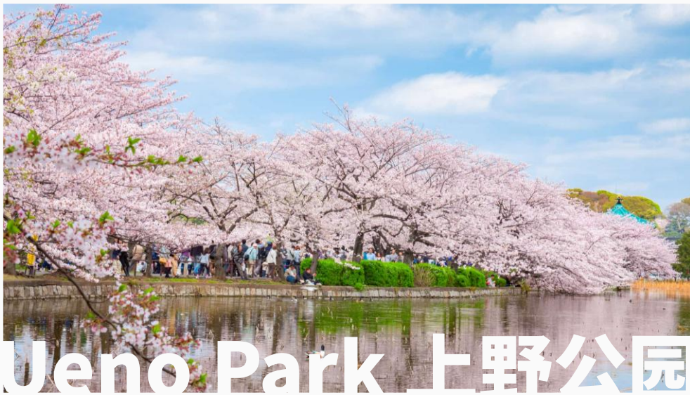
Ueno Park 上野公园