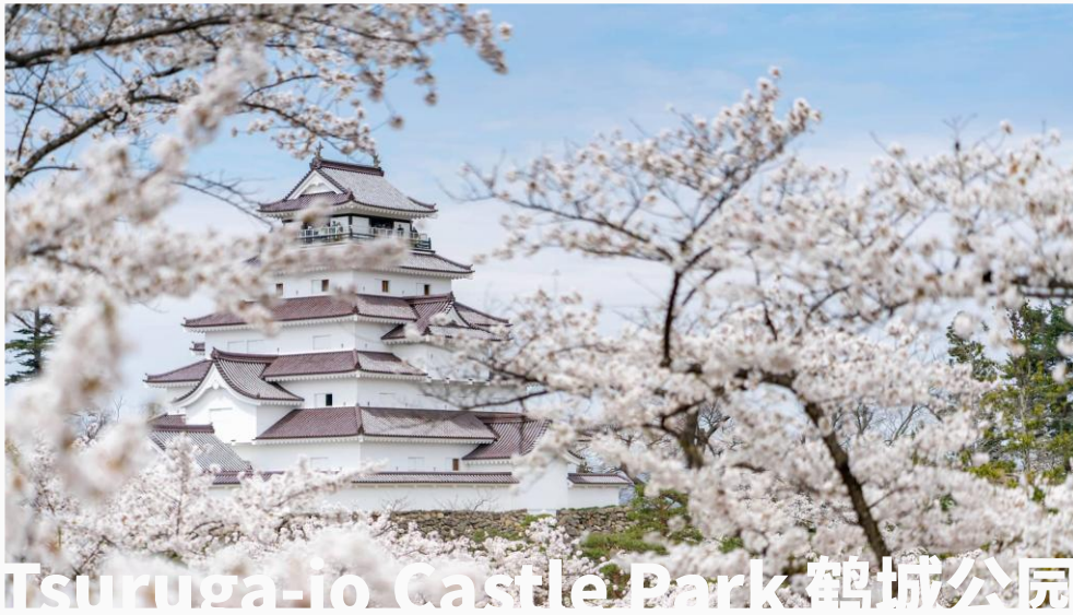
Tsuruga-jo Castle Park 鹤城公园