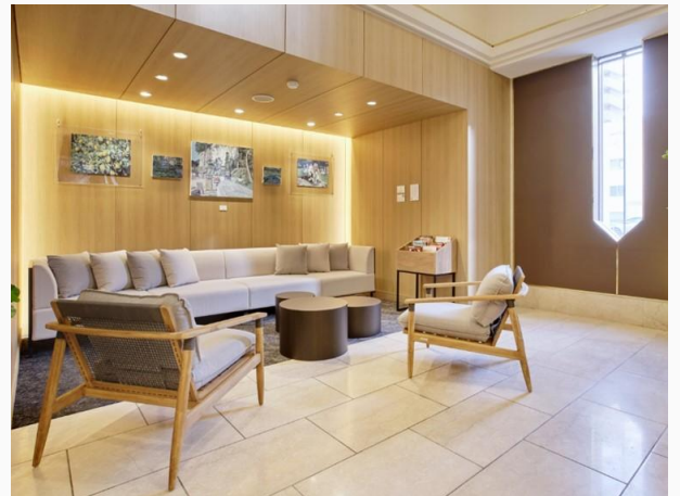
Takamatsu Park Hotel or equivalent 高松Park酒店或相同