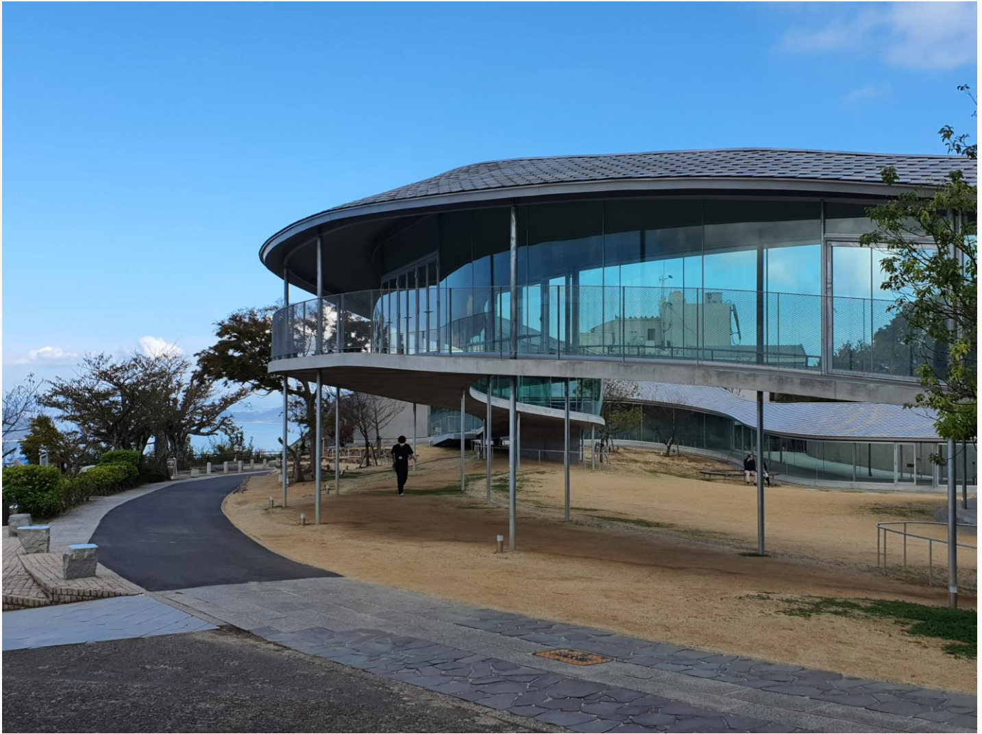
Yashimaru 屋島山上交流施設 Yashimaru