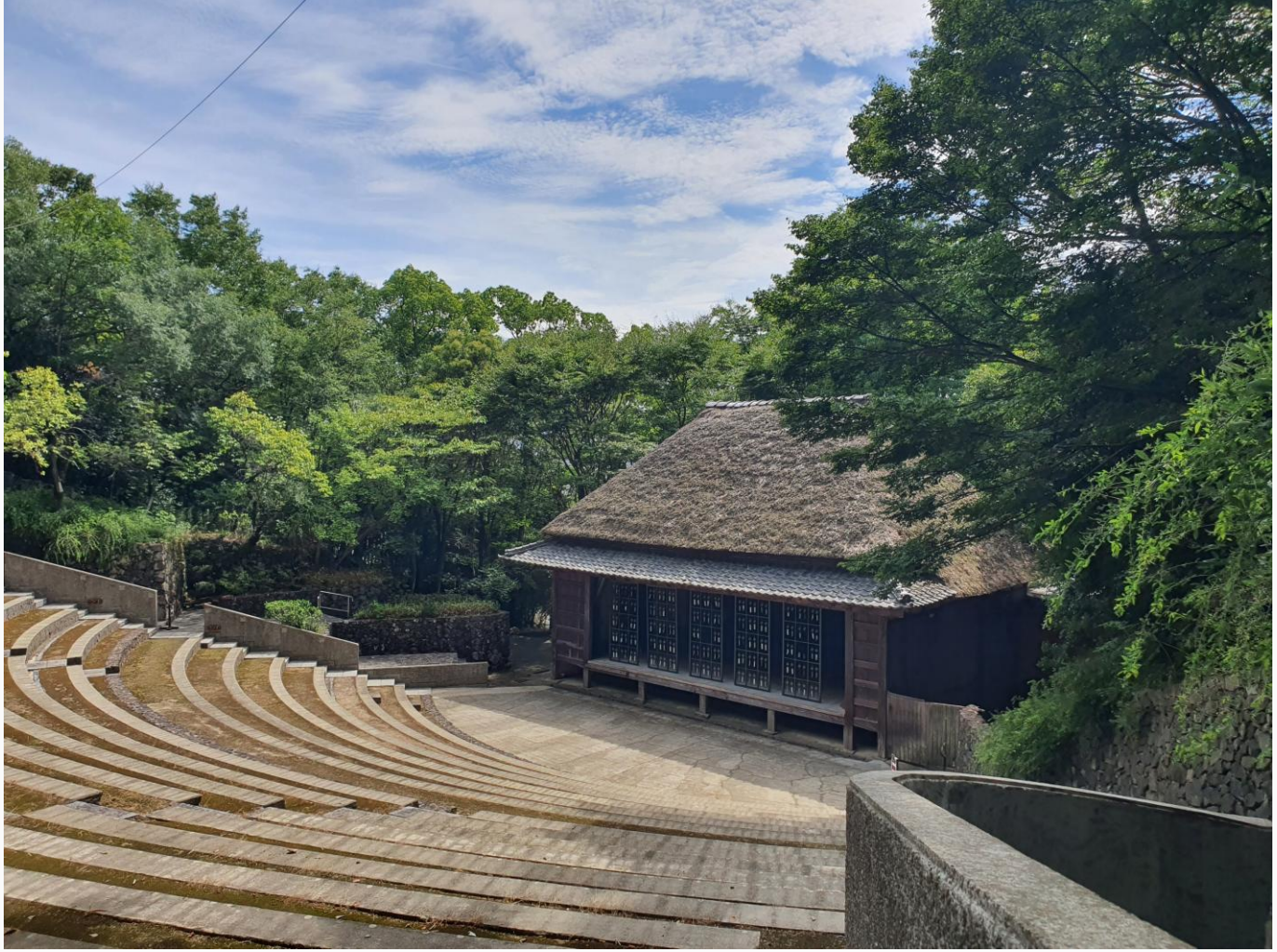
Shikokumura Museum 四国村博物館