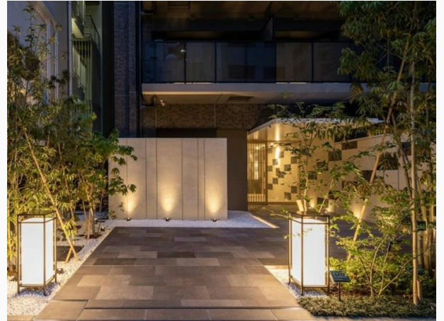
Stayat Osaka Shinsaibashi east or equivalent Stayat大阪心斋桥东或相同