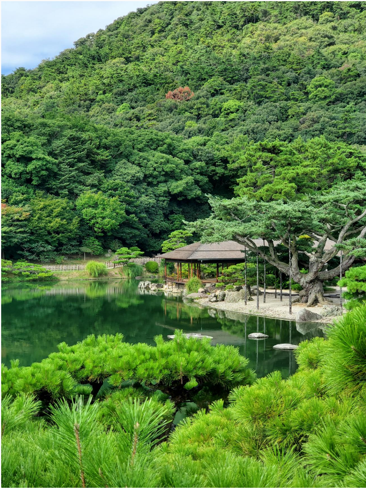
Ritsurin Garden 栗林公園