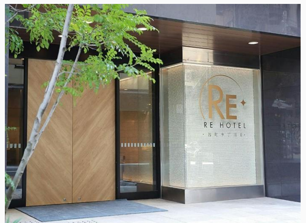
Re Hotel Tanimachi 9-Chome or equivalent 谷町9丁目Re酒店或相同