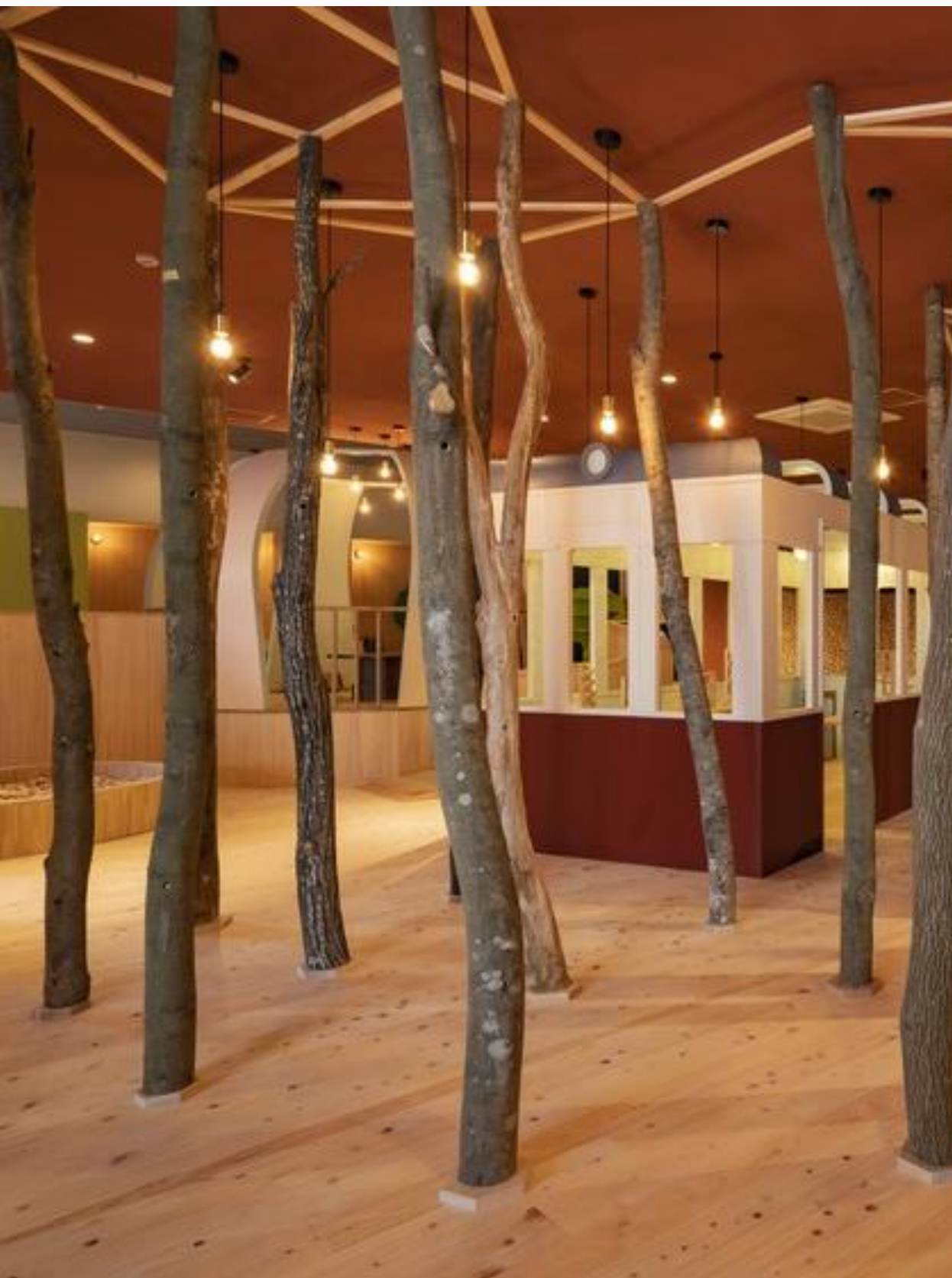
Sanuki Toy Museum 赞岐玩具美术馆