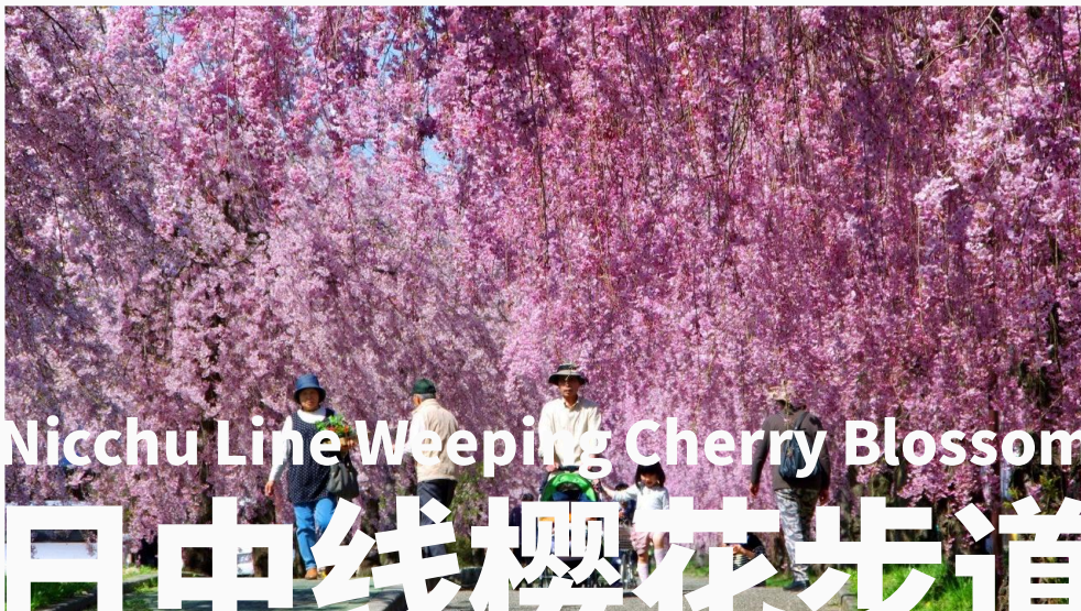
Nicchu Line Weeping Cherry Blossom 日中線櫻花步道