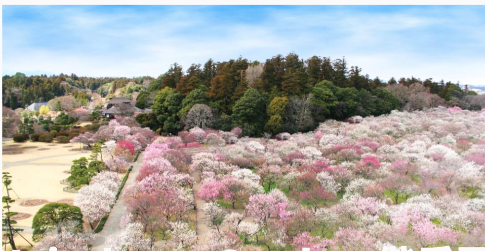
Kairakuen Garden 偕乐园