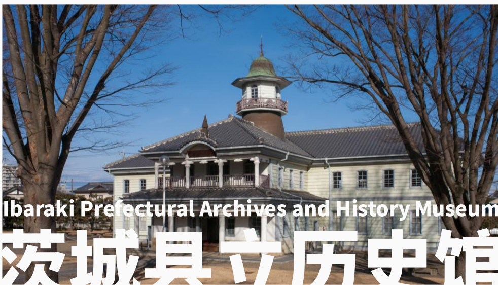
Ibaraki Prefectural Archives and History Museum 茨城县立历史馆