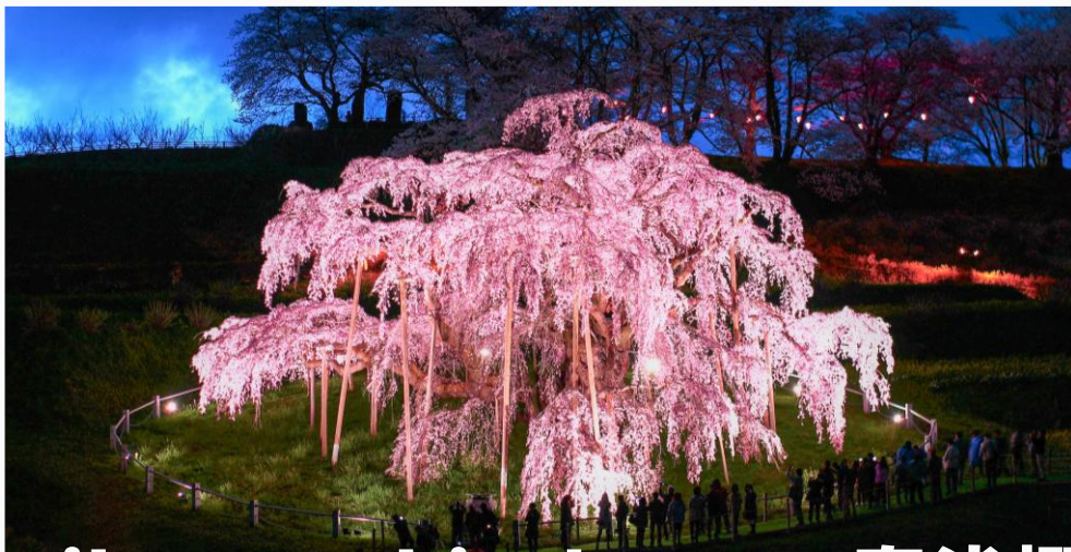
Miharu Takizakura 三春泷樱