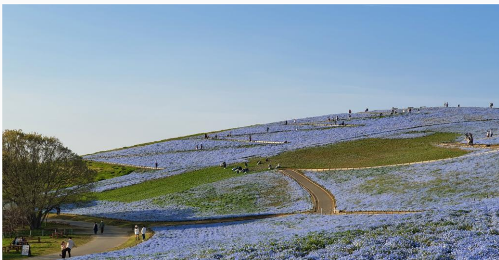
Hitachi Seaside Park 日立海滨公园