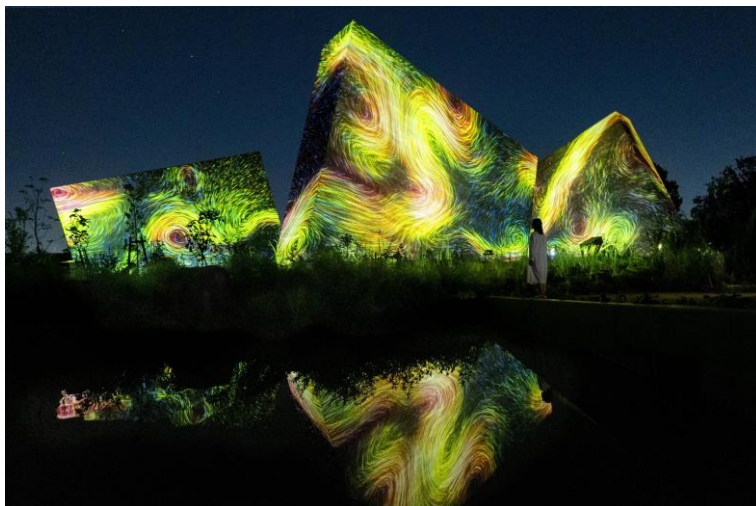
teamLab Botanical Garden