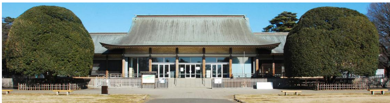
Edo Tokyo Open Air Architectural Museum