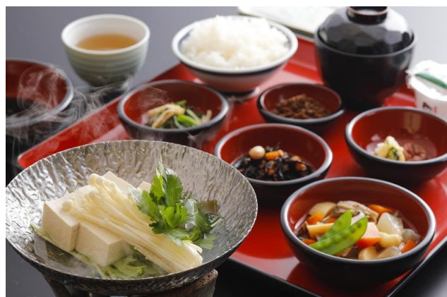
精进料理早餐 Shojin Cuisine Breakfast