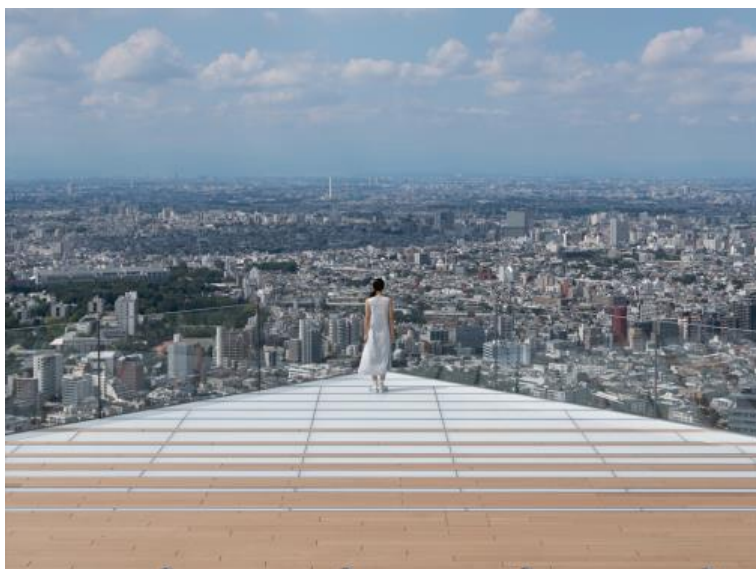
Shibuya Sky Observation Deck